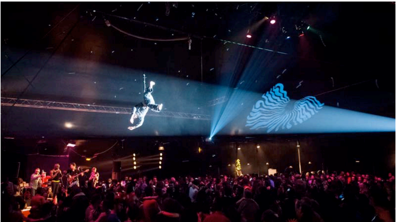
Boule à facettes humaine